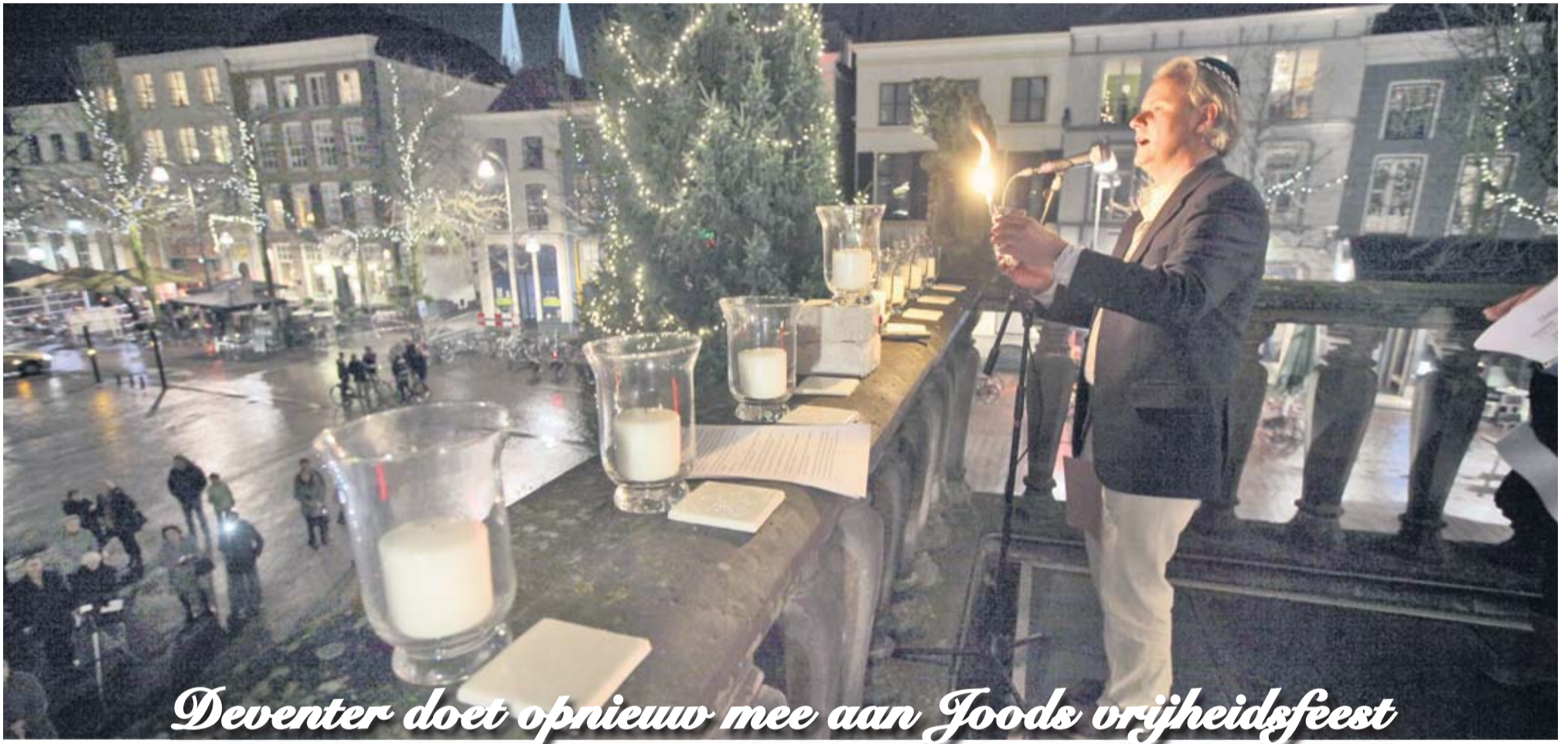
Deventer doet opnieuw mee aan Joods vrijheidsfeest